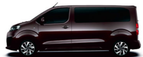
Rich Oak-Braun Metallic