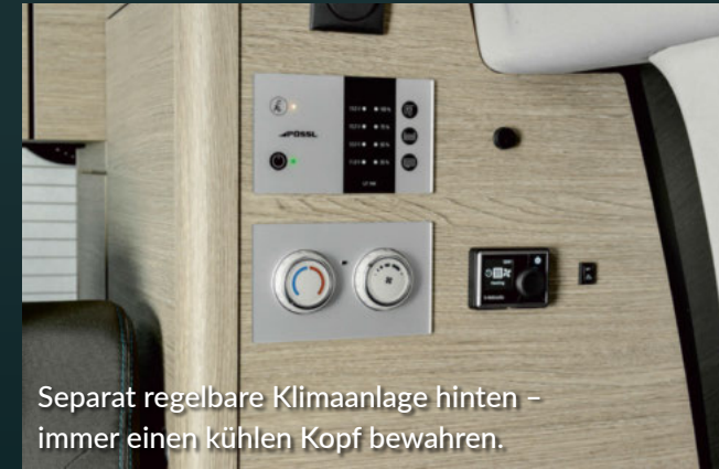
Separat regelbare Klimaanlage hinten – immer einen kühlen Kopf bewahren.