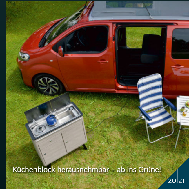
Küchenblock herausnehmbar – ab ins Grüne!