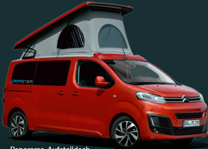
Panorama-Aufstelldach – einem himmlischen Schlaf ein Stück näher.

DER NEUE CAMPSTER IST FÜR ALLE UND ALLES ZU HABEN. DAS VERDANKT ER VOR ALLEM SEINER UMFANGREICHEN AUSSTATTUNG, DIE BEREITS IN SERIE MIT AN BORD IST. BEREIT FÜR KLEINE FAHRTEN, KURZE AUSFLÜGE ODER GROSSE REISEN.