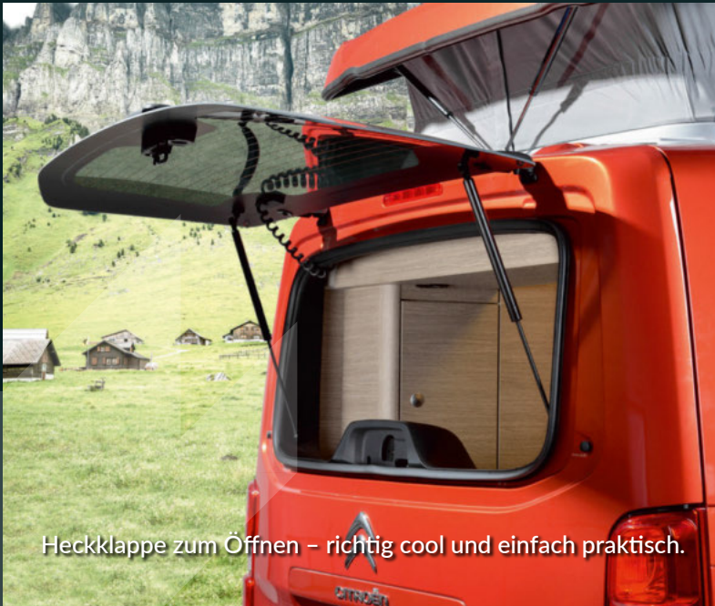
Heckklappe zum Öffnen – richtig cool und einfach praktisch.