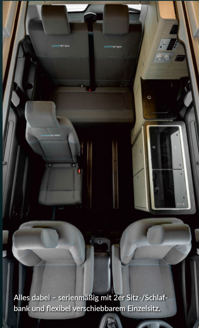
Alles dabei – serienmäßig mit 2er Sitz-/Schlafbank und flexibel verschiebbarem Einzelsitz.